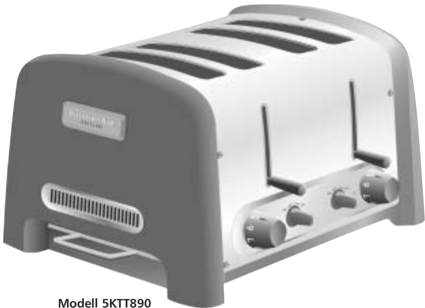
Modell 5KTT890 4-Scheiben Familientoaster