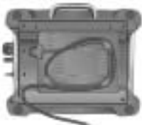
Modell 5KTT780 2-Scheiben Toaster