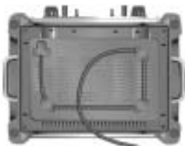
Modell 5KTT890 4-Scheiben Familientoaster