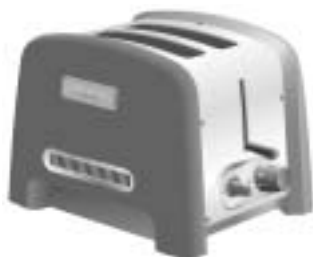
Modell 5KTT780 2-Scheiben Toaster