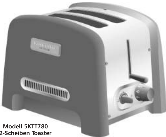
Modell 5KTT780 2-Scheiben Toaster