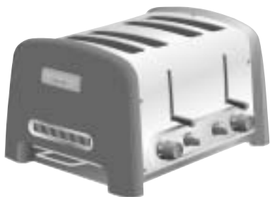
Modell 5KTT890 4-Scheiben Familientoaster

ΦΡΥΓΑΝΙΕΡΕΣ ARTISAN™ Οδηγίες χρήσης για τέλεια αποτελέσματα